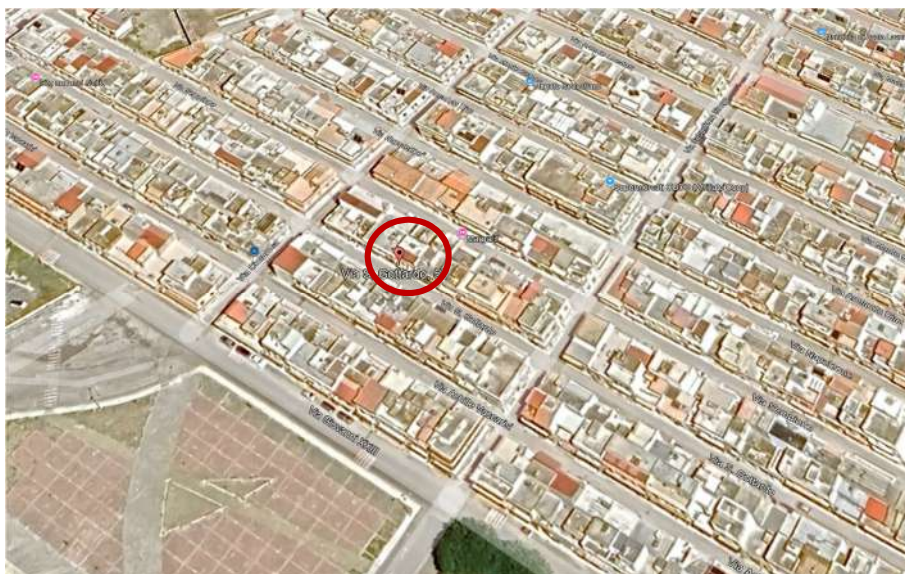
Foto1: Aerofoto immobile oggetto di stima in Avola (SR) Via San Gottardo n°56 – coordinate 36.90494749, 15.13028682