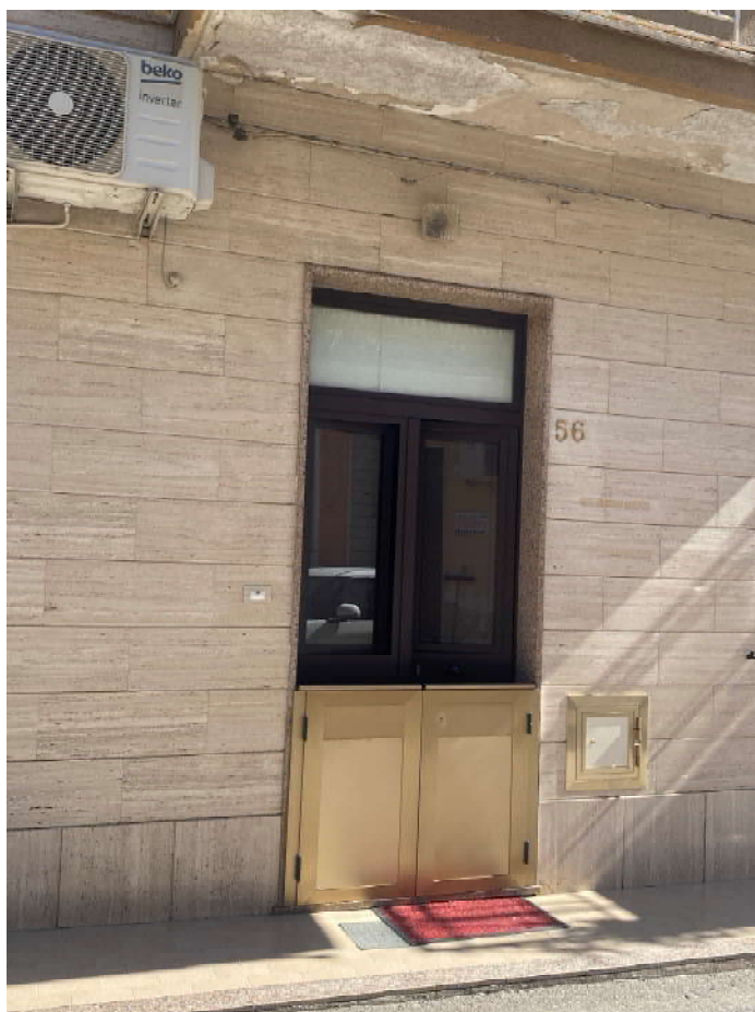
Foto 2: Vista portone di ingresso prospiciente su Via San Gottardo n°56